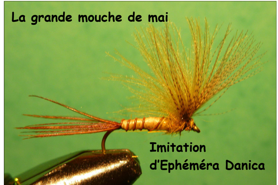
Imitation d'Ephéméra Danica