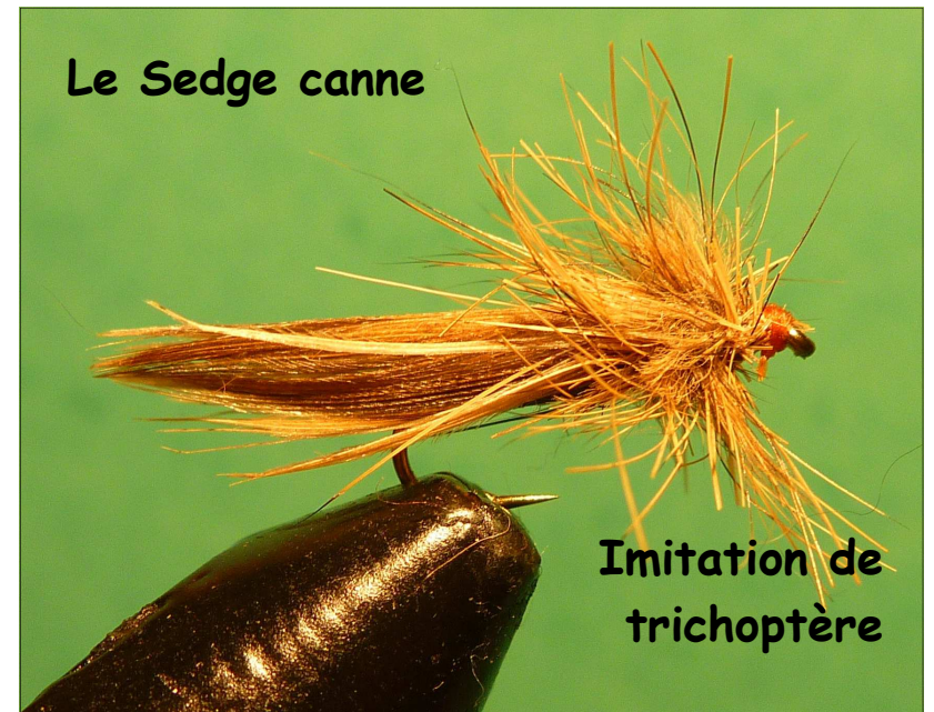
Imitation de trichoptère